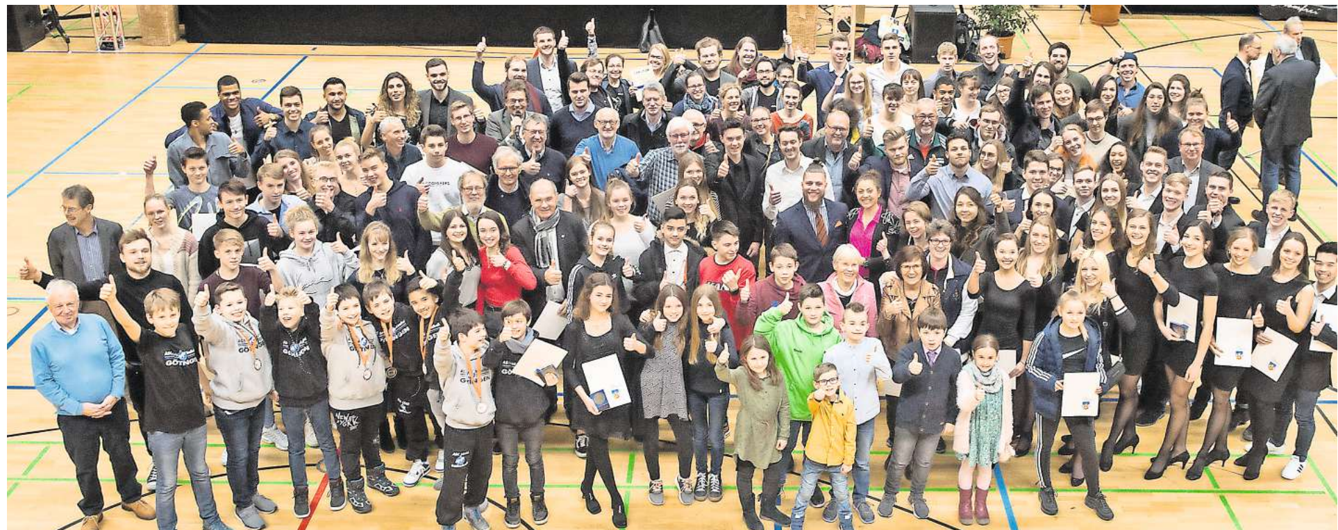
Gruppenbild mit allen Geehrten: Die Sportlerehrung 2018 war erneut eine gelungene Veranstaltung.